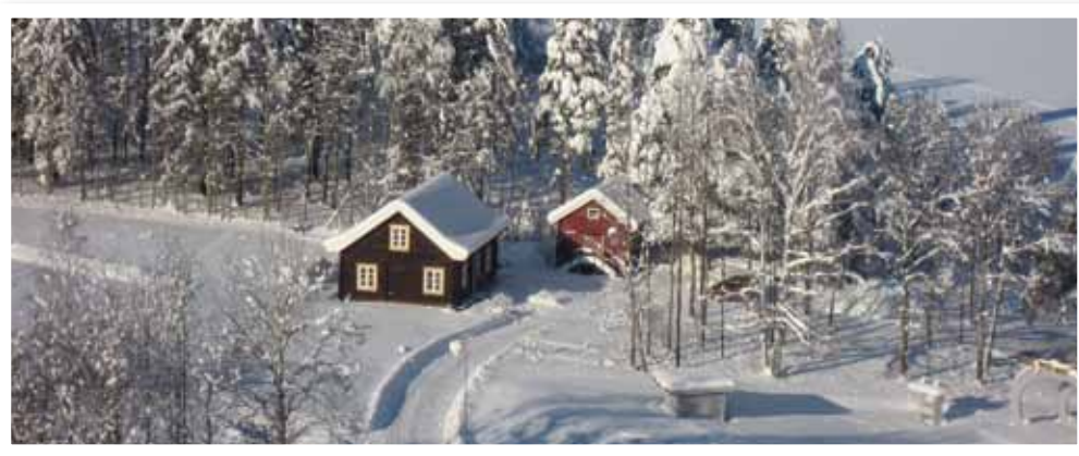
Røysehuset. Foto: Bjørn Geirr Harsson, 2009.

1. Gjenoppbygging av Røysehuset på Sundvollstranda. Bygningen, som er et gammelt tømmerhus, har stått på Søndre Fjell, Røyse, og representerer et typisk våningshus i Hole tidlig på 1800-tallet. Huset ble innviet i mai 2013 og brukes som møte- og forsamlingslokale. Historielaget har fått mange fine gaver som møbler, bilder og annet inventar til Røysehuset.