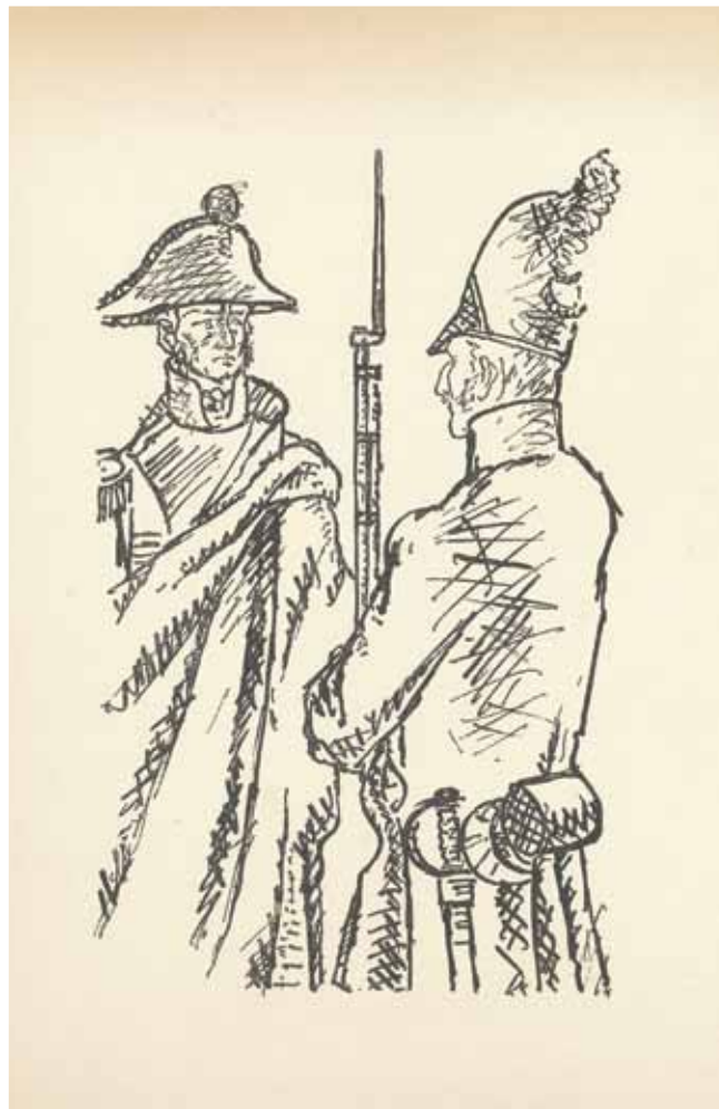
Tegning av Henrik Sørensen, som illustrerte 4. utgave (1928) av Jørgen Moes barnebok. Tegningene er senere brukt i 6. utgave (1963) og 9. utgave (1987).

«Hans grenader målte sine 187 cm og vel så det, han var skulderbred og rank som et lys, han hadde langt og drivende hvitt hår som hang i en pisk nedover den røde uniformstrøyen. Når han kom vandre opp mot gården fra husmannsplassen sin, bar han alltid øksen som et gevær over venstre skulder, og gikk stiv og strunk og satte fotbladene uttillbens og holdt takten som om sersjanten marsjerte like i hælene på ham og kommanderte: En, to! En, to!»