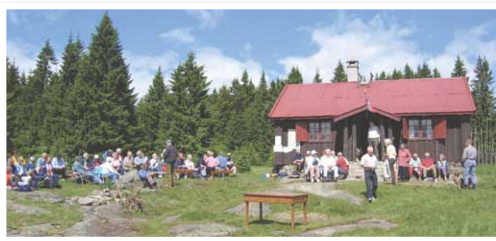
Retthellsetra på Retthelladagen. Foto: Bjørn Geirr Harsson, 2005.

2. Drift og vedlikehold av stórhus, fjøs med stall og ystebu på den gamle setra Retthella, Krokskogen. Laget har leiekontrakt med eierne av setra. Hver siste søndag i juni arrangeres Retthelladagen med servering av seterkost, kunstnerisk underholdning og foredrag.