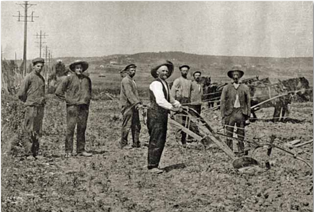
Husmenn på Stein har våronn rundt 1900.

I gamle dager satt store deler av Holes befolkning på husmannsplasser under gårdene. Husmannen hadde ofte ubegrenset arbeidsplikt, som også kunne omfatte kone og barn. Husmannsstanden økte kraftig i første halvdel av 1800-tallet. Barsedødeligheten sank merkbart, og mange yngre bondesøner måtte gå som husmenn.