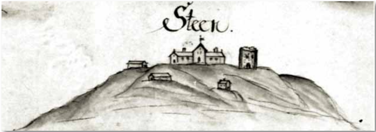
Kirken på Stein (til høyre i bildet). Utdrag fra kart tegnet i 1707.