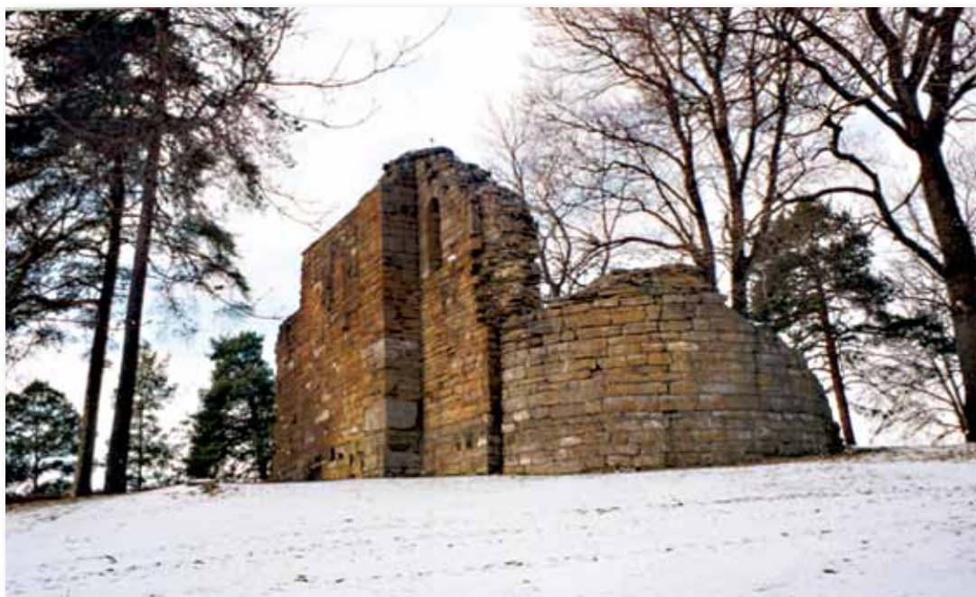
Ruiner av Stein kirke fra siste halvdel av 1100-tallet. Foto: Jan Fredrik Hornemann, 1999.

Ruinene av Stein kirke ligger blant husene på Stein gård, bare 330 meter fra Halvdanshaugen. Kirken ble bygd av kalkstein og sandstein i romansk stil midt på 1100-tallet, og ble på 1200-tallet sognekirke i Steins sogn. Her var det etter alt å dømme også kirkegård.