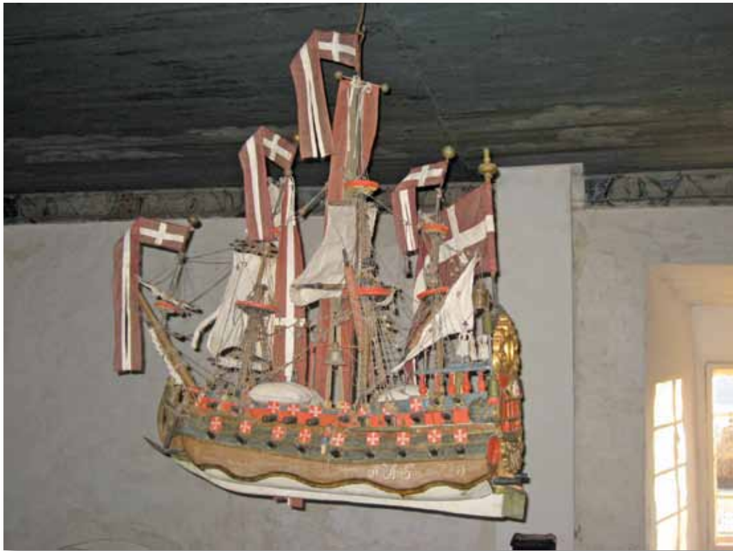
Kirkeskipet i Bønsnes kirke. Foto: Bjørn Geirr Harsson, 2007.

Mange eldre kirker har et kirkeskip, en skipsmodell som er hengt opp over midtgangen og tjener som et symbol for kirken. Kristus befinner seg ombord, og da vet man at kirken ikke kan gå under. Skipet framstår ofte som en stilisert modell av Noas ark, og henger vanligvis i øst-vest-retning.