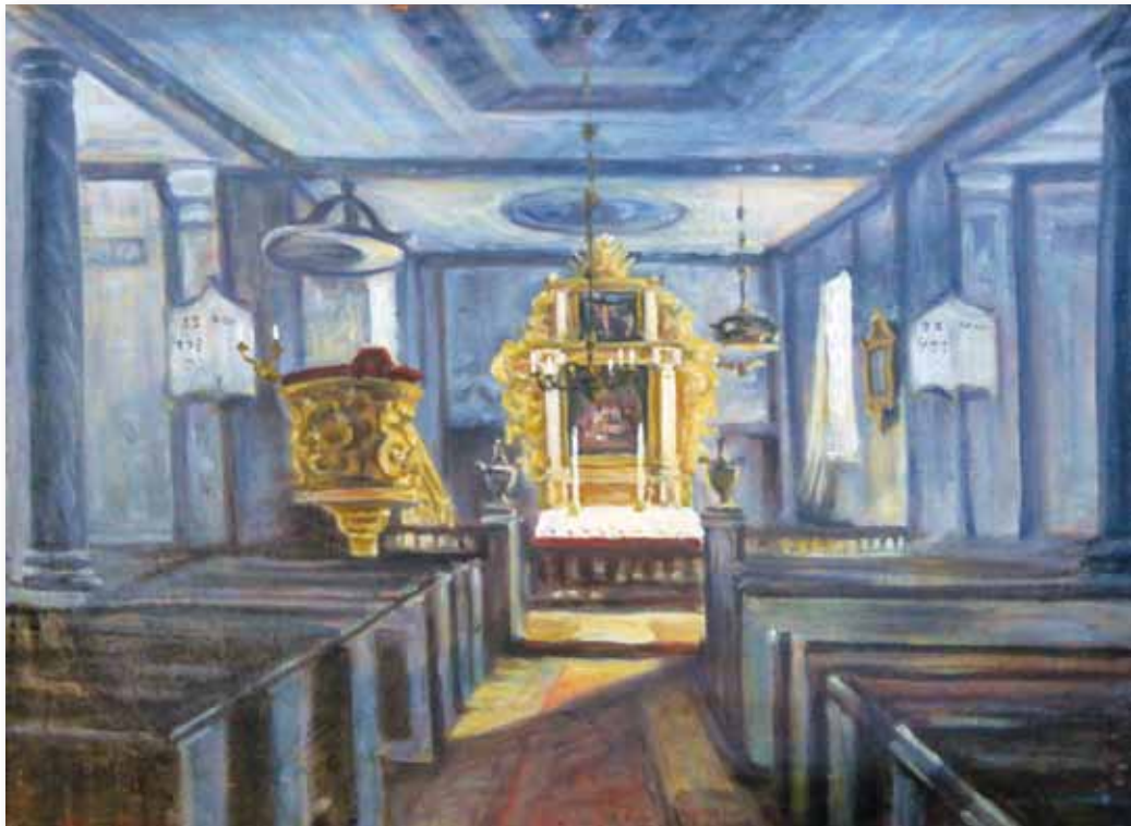
Interiør i Hole gamle kirke. Maleri av Harald Vibe.

Da den gamle kirken brant ned i 1943 gikk prekestolen og himlingen fra 1736 tapt, men man klarte å redde det meste av inventaret, som nå står på plass i den nye kirken. Harald Vibes maleri viser kirkeinteriøret før brannen.