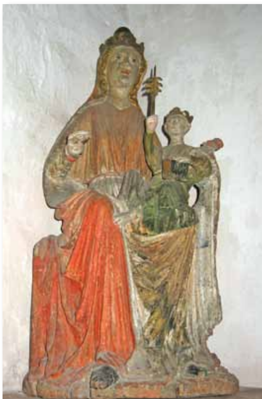
Maria med barnet i Bønsnes kirke.

Skulpturen av Maria med barnet på kneet er tidfestet til midten av 1200-tallet. Figuren er det eldste inventaret i kirken, og står på en hylle i det sørøstre hjørnet. På hodet har Maria krone av kløverblad med slør. Kjolen er smal med folder og belte rundt livet, og en kappe henger ned fra skuldrene. Barnet har krone på hodet, og holder i høyre hånd et liljescepter, mens venstre hånd hviler på en tykk bok.