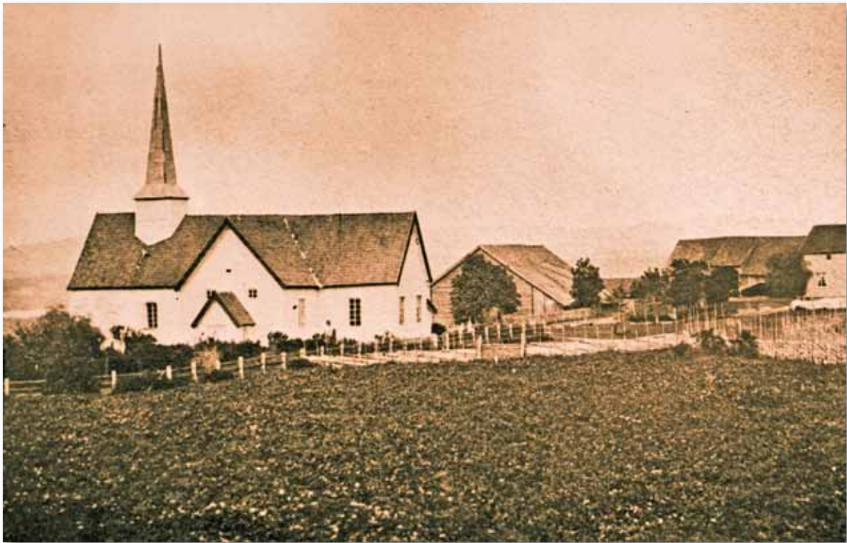
Hole kirke i 1856. Prestegården til høyre.

Hole kirke er oppført i stein, trolig mot slutten av 1100-tallet, men i dag er det bare skipet, den vestlige delen, som står igjen av middelaldermurene. I 1660 ble kirken utvidet med en tømret del mot vestsiden av skipet, og i 1696 ble det murt opp et sakristi på nordsiden av koret.