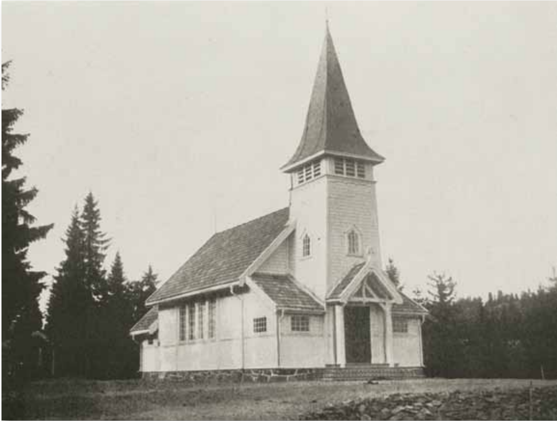
Sollihøgda kapell. Bildet er hentet fra boka "Hole i bilder 1850-1950", 1981.