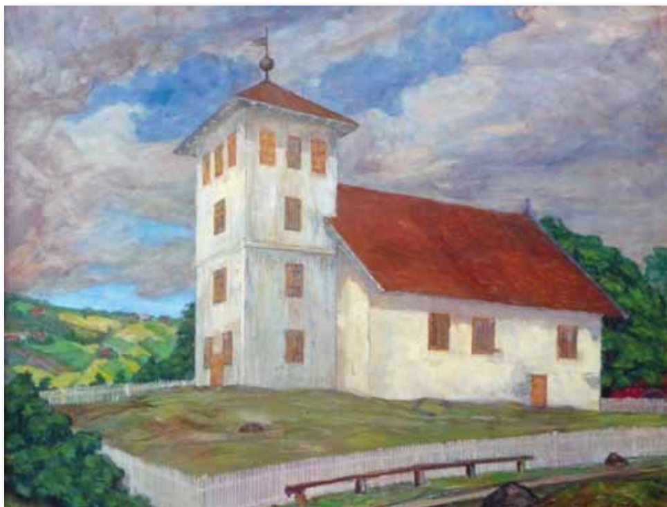
Bønsnes kirke, malt av Anders Castus Svarstad i 1932.

Bønsnes kirke er trolig fra annen halvdel av 1200-tallet. Den er en langkirke med skip og kor som danner et rektangulært rom, en kirketype som ble vanlig i Norge etter 1250. Det har versert et sagn om at kirken skulle være bygget av Olav den hellige etter at han ble reddet av «Vår Herre» fra et kraftig uvær på fjorden. Men dette sagnet viser seg å være fra slutten av 1800-tallet, og tilsvarende sagn finnes flere steder langs norskekysten.