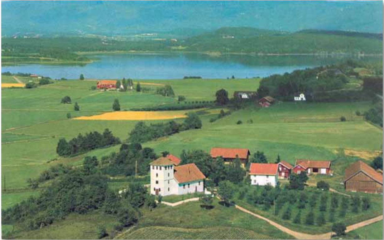
Bønsnes kirke ca. 1950 med tre Svarstad-gårder i bakgrunnen.

Hole kirke, Bønsnes kirke, kirkeruinene på Stein - knapt noen bygd her i landet har så tradisjonsrike kirkebygninger som Hole. I tillegg har vi Halvdanshaugen og et stort antall fornminner. Fra gammelt av heter det at Olav den hellige, som innførte kristendommen i Norge skal være født på Bønsnes.