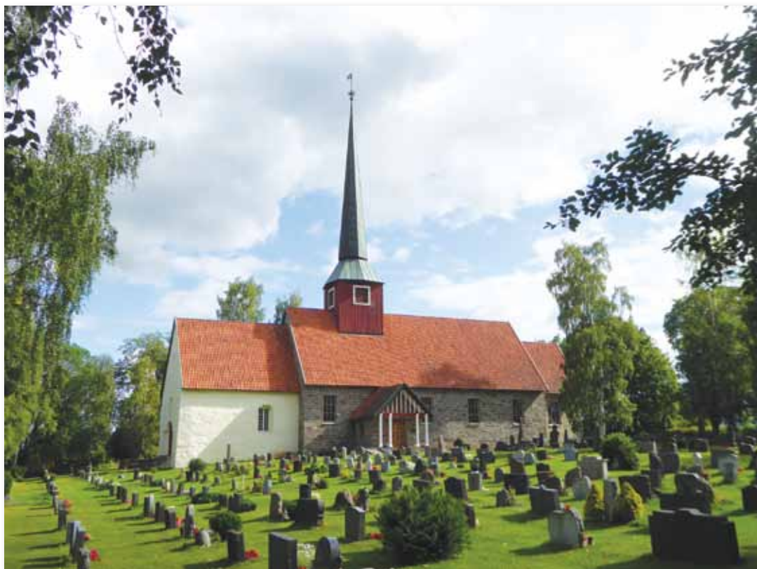
Hole kirke.

Etter at kirken ble ødelagt av brann i 1943, var det bare steinmurene i skipet som sto tilbake. Krigen gjorde at det tok lang tid før gjenreisningsarbeidet kunne komme i gang, og gravkapellet fra 1914 ble midlertidig brukt som kirke. Først i 1950 ble byggearbeidene igangsatt etter tegninger av arkitekt Finn Bryn. Det ble brukt sandstein fra distriktet, og kirken ble innviet 5. september 1954.